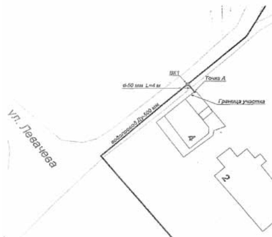
СХЕМА наружной водопроводной сети с указанием точки подключения Объекта

Точка А – точка подключения объекта/граница раздела балансовой принадлежности ВК1 – вновь устанавливаемый колодезь на действующих сетях