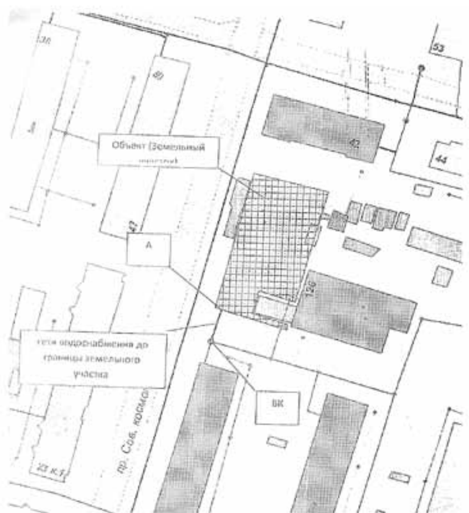
СХЕМА наружной водопроводной сети с указанием точки подключения Объекта

Точка А – точка подключения объекта/граница раздела балансовой принадлежности ВК – существующий колодезь на действующих сетях. Протяженность сети водопровода к Объекту/земель: Ду100 мм, 12 м