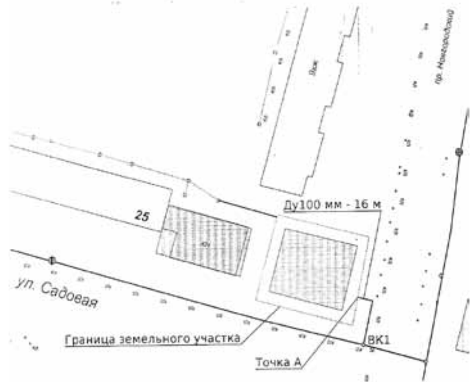
СХЕМА наружной водопроводной сети с указанием точки подключения Объекта

Точка А – точка подключения объекта/граница раздела балансовой принадлежности