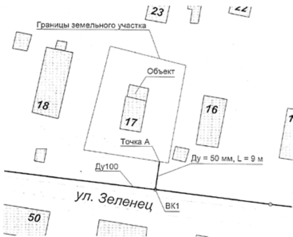
СХЕМА наружной водопроводной сети с указанием точки подключения Объекта

Точка А – точка подключения объекта/граница раздела балансовой принадлежности ВК1 – проектируемый колодец на действующем водопроводе Ду100 мм