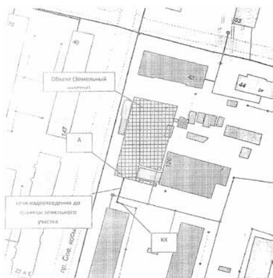
СХЕМА наружной канализационной сети с указанием точки подключения Объекта

Точка А – точка подключения объекта/граница раздела балансовой принадлежности КК – существующий колодезь на сети канализации. Протяженность сети канализации: Коллектор Ду150 мм, 18 м