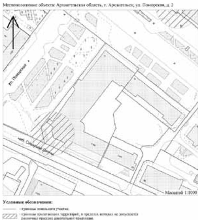
Схема № 202 границ прилегающей территории негосударственного образовательного учреждения дополнительного образования «Северо-западная лингвистическая школа «Ты говоришь»

Приложение № 2 к постановлению мэрии города Архангельска от 07.04.2014 № 278