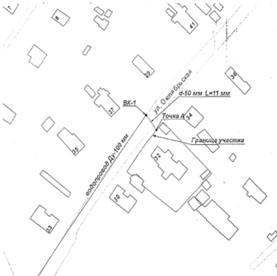
СХЕМА наружной водопроводной сети с указанием точки подключения Объекта

Точка А – точка подключения объекта/граница раздела балансовой принадлежности ВК1 – колодец на действующих сетях